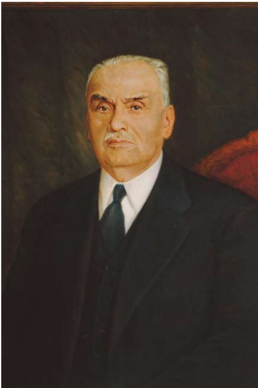
Colección de Pintura del Banco Central de Chile. Autor: A. Sepúlveda.