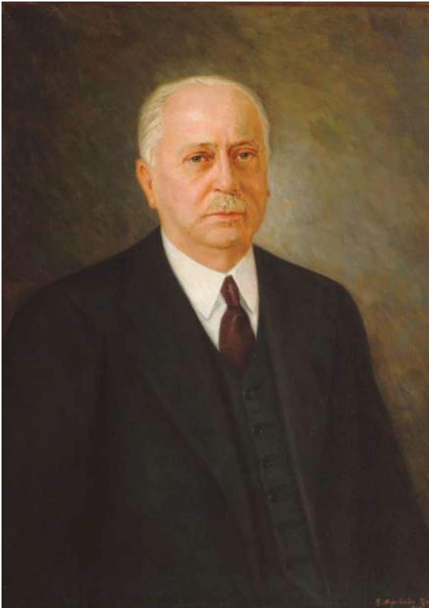
Colección de Pintura del Banco Central de Chile. Autor: A. Sepúlveda.