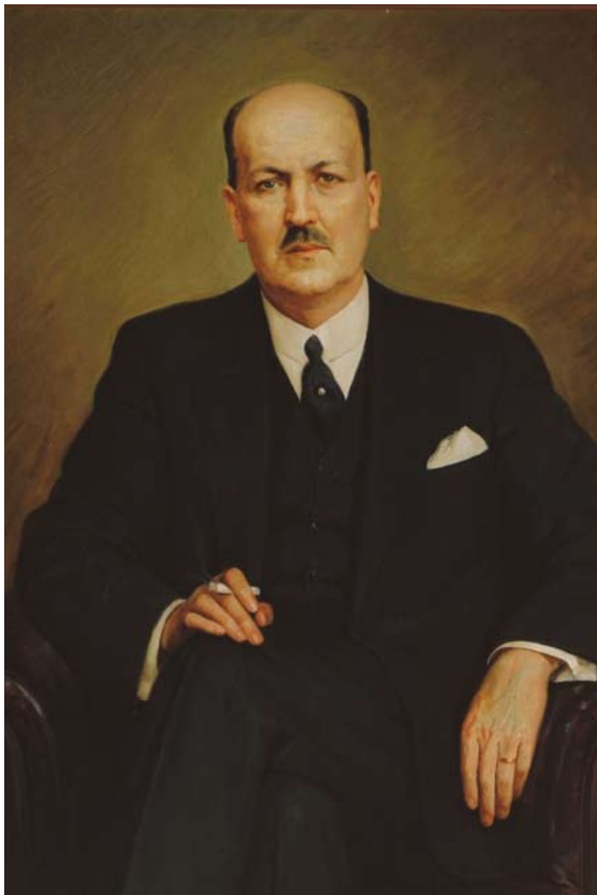
Colección de Pintura del Banco Central de Chile. Autor: Anónimo.