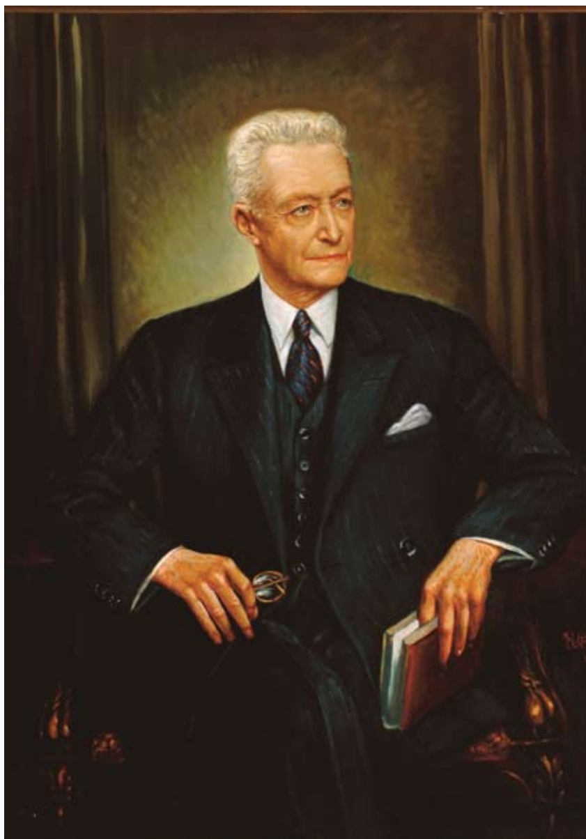
Colección de Pintura del Banco Central de Chile. Autor: M. Huidobro