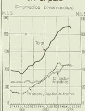
Medio circulante en el país