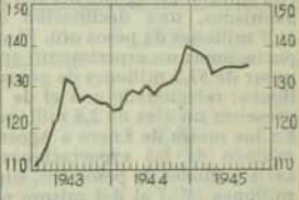
Bolsa de Valores Índice de acciones (Febrero de 1941=100)