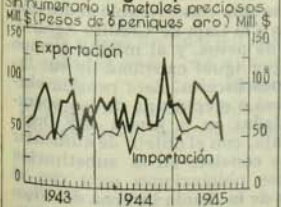
Comercio Exterior Importación y Exportación