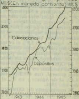
Bancos Comerciales Colocaciones y Depósitos