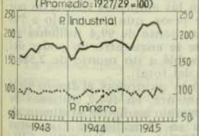
Producción Indicadores de la producción industrial y minera (Promedio: 1927/29=100)