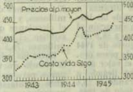
Precios Indicadores de precios al por mayor y del costo de la vida en Santiago (Marzo de 1928=100)