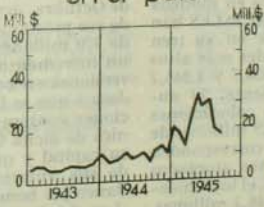
Letras protestadas en el país