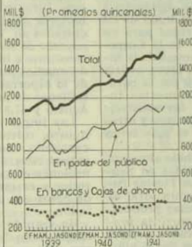
Medio Circulante en el país