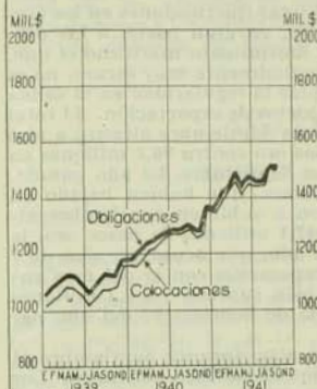
Banco Central de Chile Colocaciones y Obligaciones