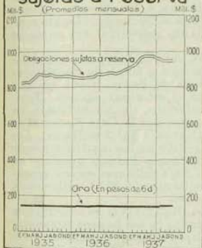
Banco Central de Chile Oro y Obligaciones sujetas a reserva