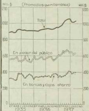
Medio Circulante en el país