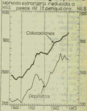
Bancos Comerciales Colocaciones y Depósitos