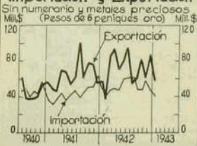
Comercio Exterior Importación y Exportación