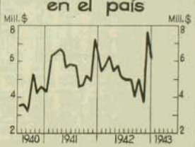
Letras protestadas en el país