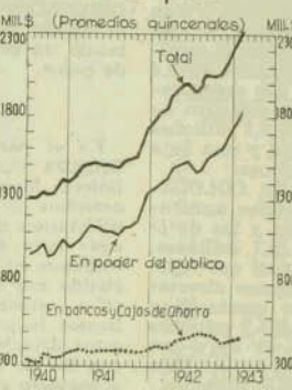
Medio Circulante en el país