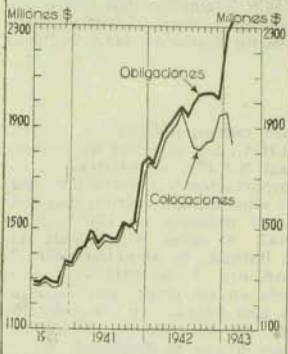
Banco Central de Chile Colocaciones y Obligaciones