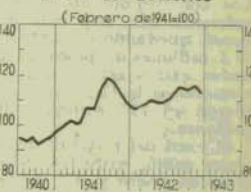
Bolsa de Valores Índice de acciones