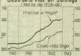
Precios Índices de precios al por mayor y del Costo de la vida en Santiago