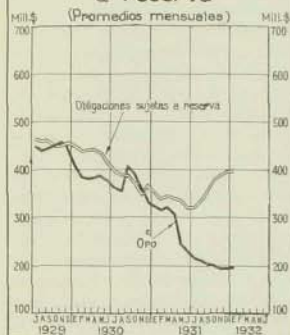
Banco Central de Chile Oro y obligaciones sujetas a reserva