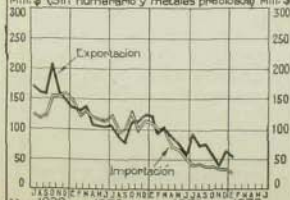
Comercio exterior Importación y exportación