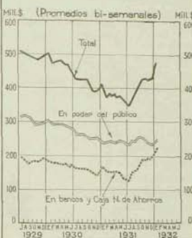
Medio circulante en el país