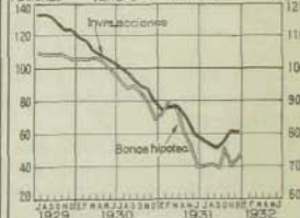
Bolsa de valores Índice de inversiones en acciones e índice de bonos hipotecarios