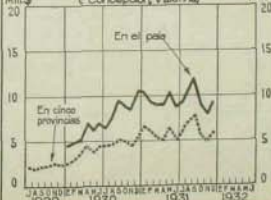
Letras protestadas En el país y en cinco provincias