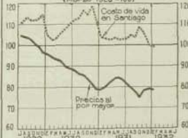
Precios Índice de precios al por mayor y del costo de la vida en Santiago