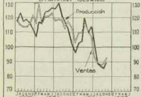
Industrias Índice general de producción y ventas